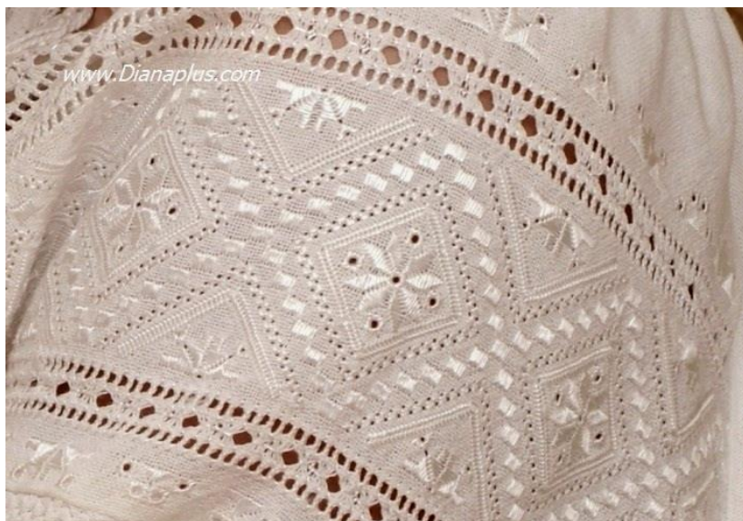
Орнаменти вишивки, характерні для Сумщини.