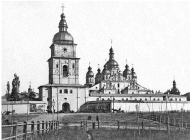
Михайлівський золотоверхий собор (споруджено 1108-1113р.р.- зруйновано 1934-1935р.р.)