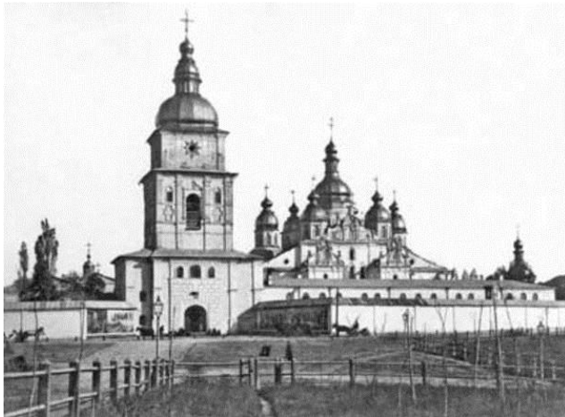
Михайлівський золотоверхий собор (споруджено 1108-1113р.р.- зруйновано 1934-1935р.р.)