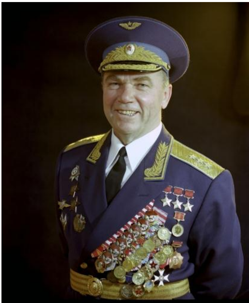
Генерал-полковник авіації (з 1985 року – маршал авіації), Фото 1980 р.