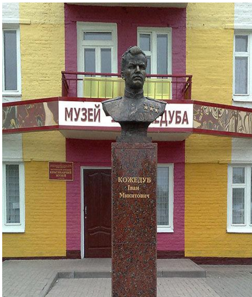
Бюст у місті Шостка Сумської області біля музею І. М. Кожедуба (встановлено у 2010 році).

не зробив кар'єри на військово-чиновницьких сходах, хоча і отримав на заході життя маршальські зірки.