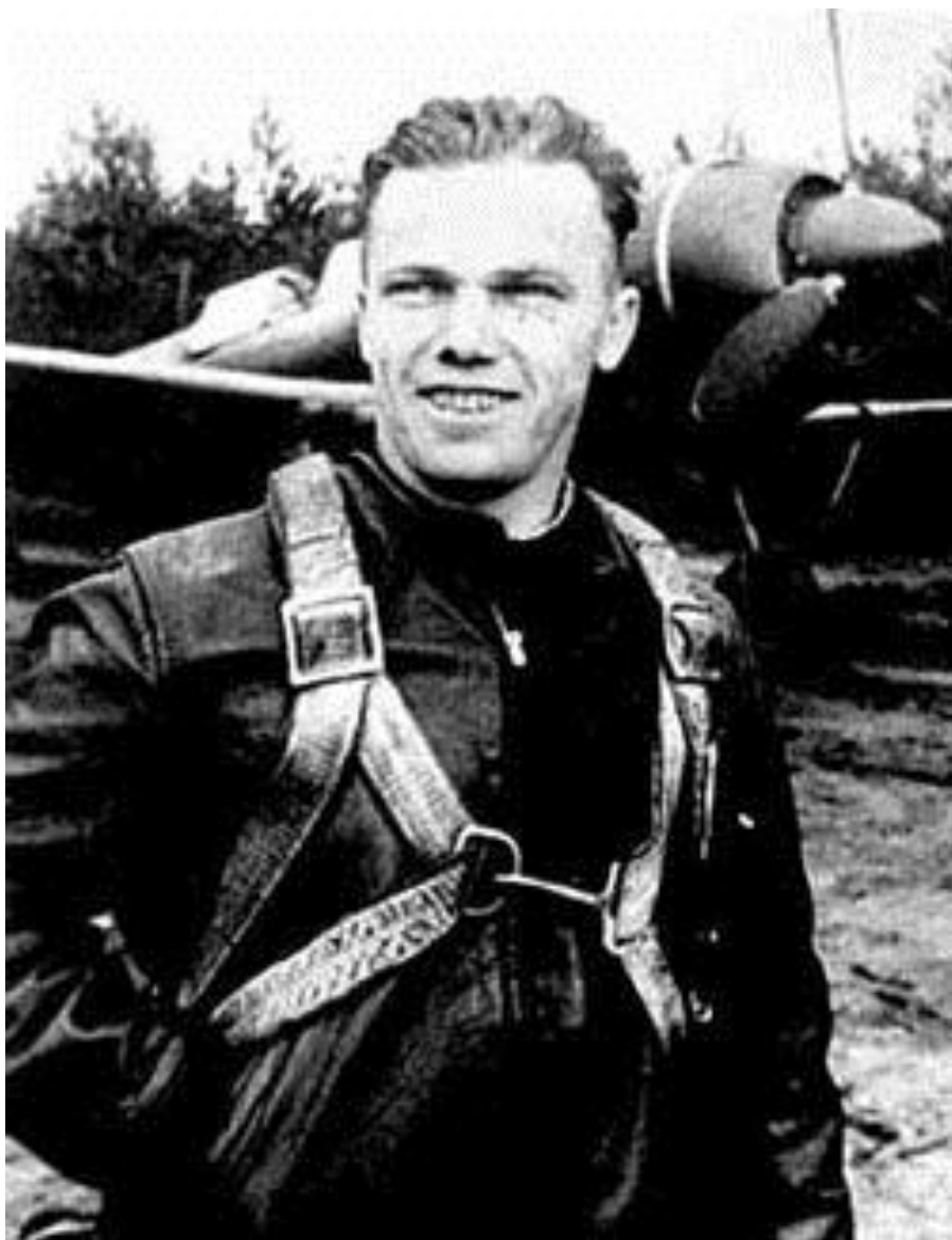
Іван Кожедуб – майбутній ас.