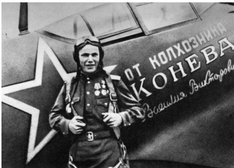
Іван Микитович Кожедуб на фоні Ла-5ФН (бортовий № 14) 1944 рік.